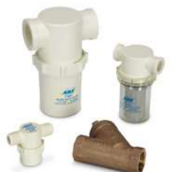
Filtros de entrada