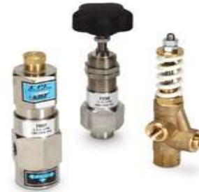
Reguladores de presión