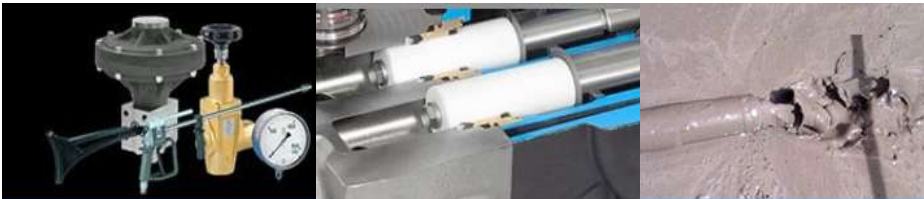
Valvulas y accesorios