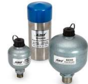
Amortiguador de pulsaciones