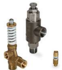
Válvula de apertura