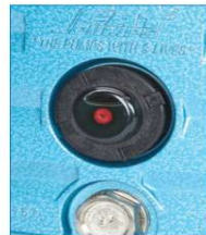
Rotacion hacia atras