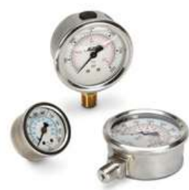
Medidores de presión