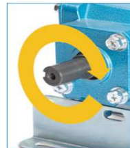
Rotacion haia delante